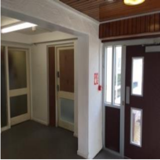
Tu fewn l'r prif gyntedd