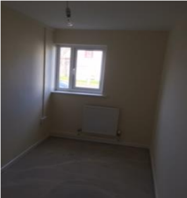
Llofft fach gwely sengl