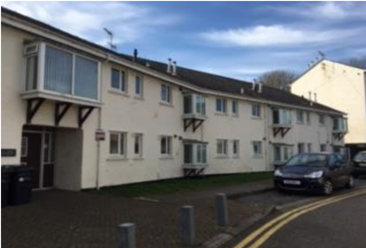
Tu blaen bloc B