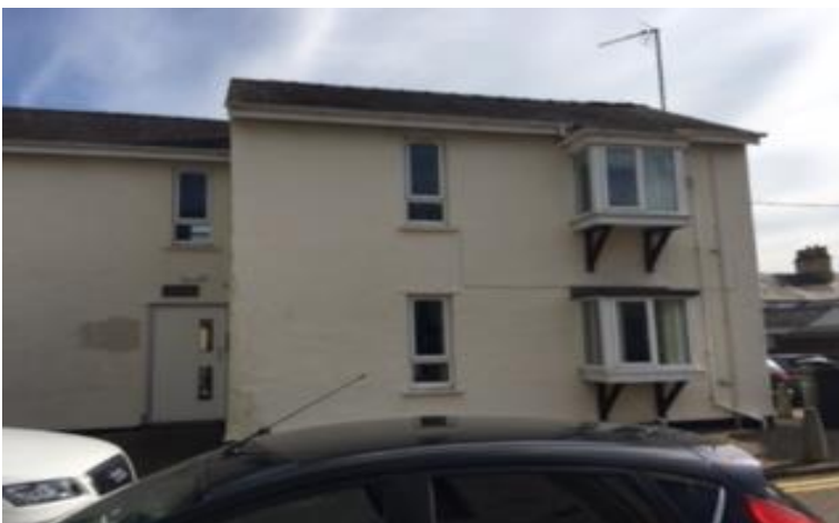
Tu blaen bloc A