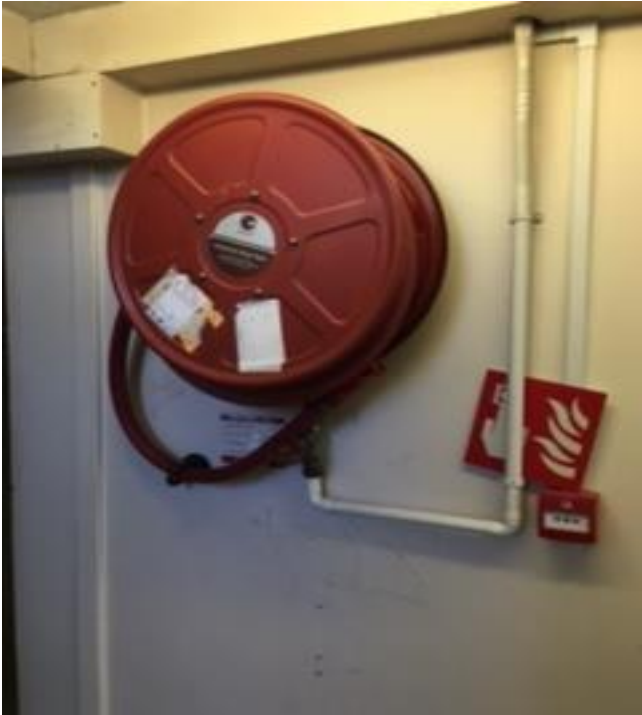
Offer diffod tan