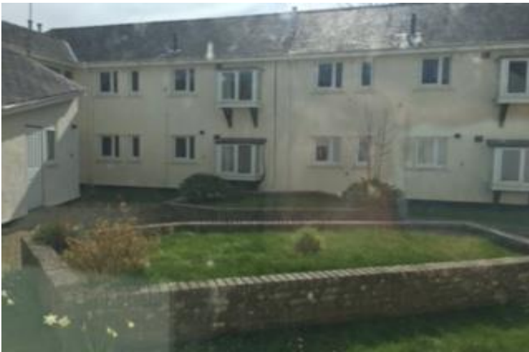
Gardd tu caefn bloc B