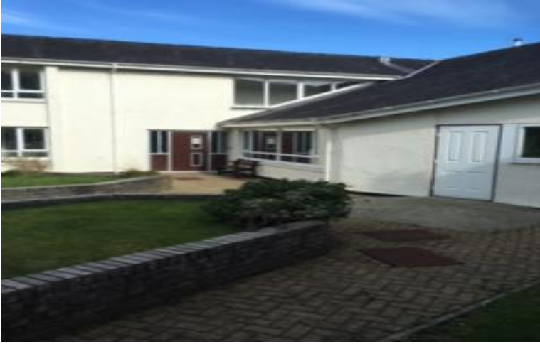
Tu cefn bloc B