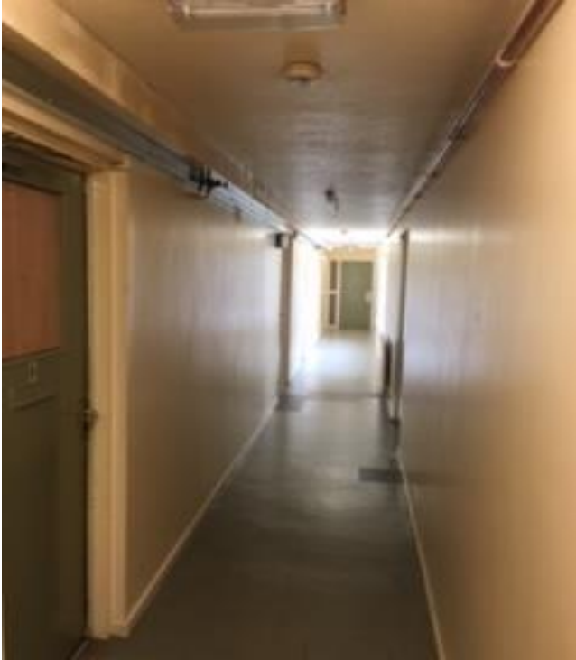
Cyntedd tu mewn bolc B